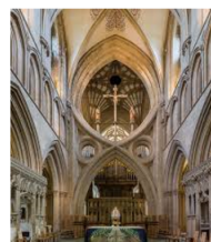
Wells Cathedral, Südengland

ABENDGEBET IN DER TRADITION DER ANGLIKANISCHEN KIRCHE